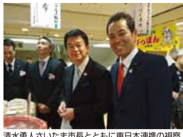
清水勇人さいたま市長とともに東日本連携の視察