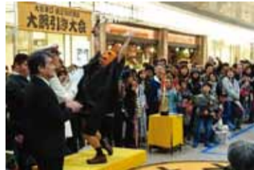
大宮駅東口西口対抗大綱引き大会に参加