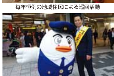
駅頭で防犯のまちづくりキャンペーン