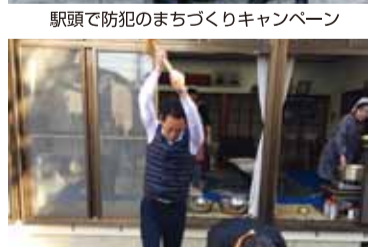
各地区の餅つきに参加