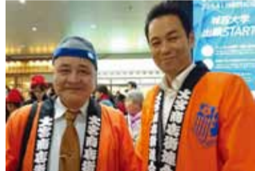
綱引き大会で地元大宮商店街連合会長と