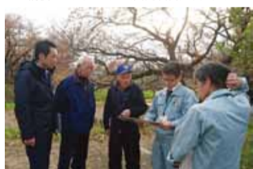
地域からの声にすぐ動き、行政とともに現場へ確認