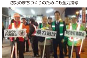
毎年恒例の地域住民による巡回活動