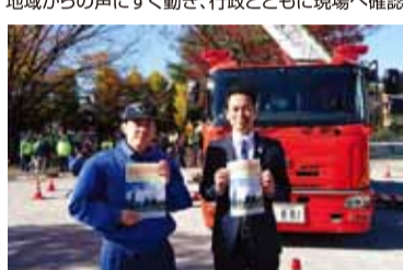
防災のまちづくりのためにも全力投球