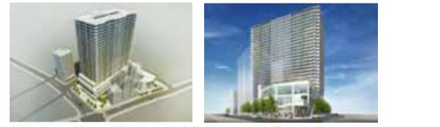
大宮駅西口3-B地区第一種市街地再開発事業の完成予想図(全景及びB棟)(平成29年3月17日市街地再開発組合設立認可がなされ、平成33年中の工事完了を目指して事業推進中)