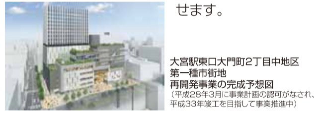
大宮駅東口大門町2丁目中地区第一種市街地再開発事業の完成予想図(平成28年3月に事業計画の認可がなされ、平成33年竣工を目指して事業推進中)