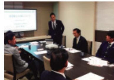
講師として、講演会でのコマ

位置づけています。この最後とも言われているまちづくりのチャンスを逃すことなく、①駅周辺街区のまちづくり、②交通基盤整備、③駅機能の高度化、等を推進していくため「大宮駅グランドセントラルステーション化構想」は作成されています。誇れる都市として全力で取り組んで参りたいと思います。