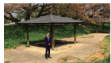
声をかたに。東屋の一部改修