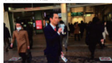
駅頭にて政策を訴える