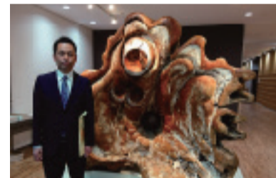
4月1日子ども家庭総合センター「あいばれっと」が開設