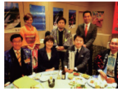
大宮を舞台に東日本連携。南砺市、氷見市長らと