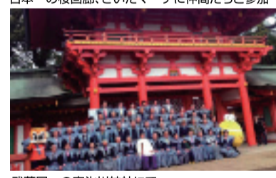
武蔵国一の宮氷川神社にて