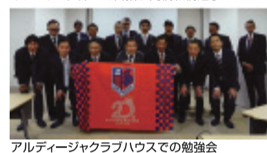
アルディージャクラブハウスでの勉強会