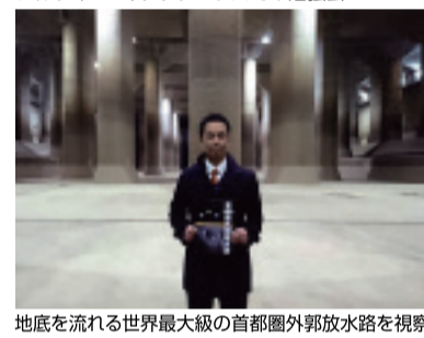
地底を流れる世界最大級の首都圏外郭放水路を視察