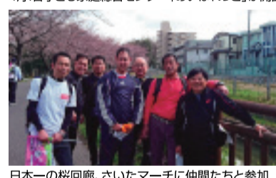
日本一の桜回廊、さいたまーチに仲間たちと参加