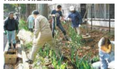
氷川参道でおもてなしのまちづくりを