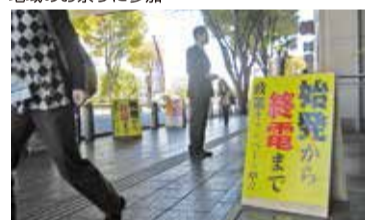
ど根性の21時間連続駅立ち