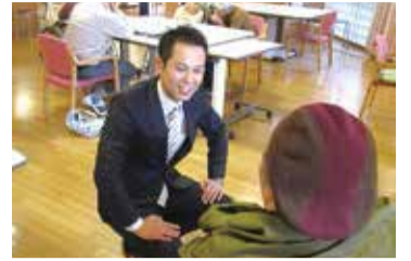
高齢者が安心して暮らせるまちへ

政務活動費のみえる化 (政務活動費を含めた議会の情報公開) 使途基準の明確化と厳格化 渡しきりの見直し(現在、全額前払いを 後払い清算にする)