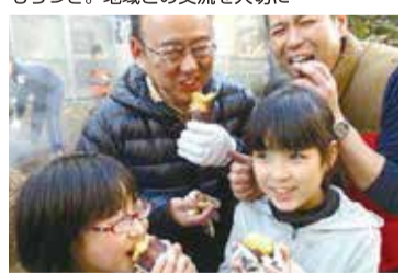
子どもたちと焼きいもづくり