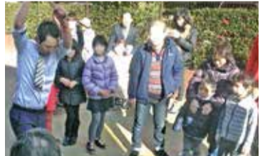
もちつき。地域との交流を大切に