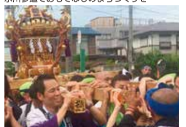
地域のお祭りに参加