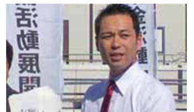
大宮駅にて募金活動