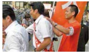
同志の応援も欠かせない