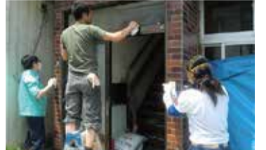
東日本大震災。何度も現地入り