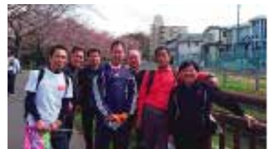
日本一の桜回廊、さいたまマーチに仲間たちと参加