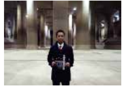
地底を流れる世界最大級の首都圏外郭放水路を視察