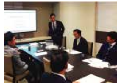
講師として、講演会での一コマ

ディズニーランドなど人気観光施設など点在する湾岸エリアにも都心を通ることなくアクセスすることが可能になります。もちろん、物流に関しても所要時間が短縮されます。この開通によって外環道は6割が完成し、4つの放射道路(東関東道・常磐道・東北道・関越道)が接続されました。