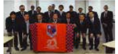
アルディージャクラブハウスでの勉強会