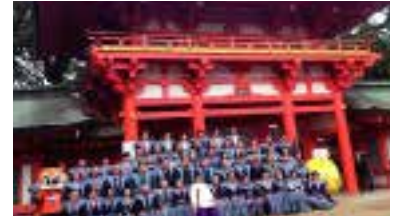
武蔵国一の宮氷川神社にて