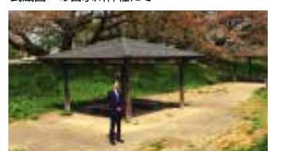
声をかたちに。東屋の一部改修