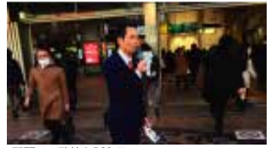
駅頭にて政策を訴える