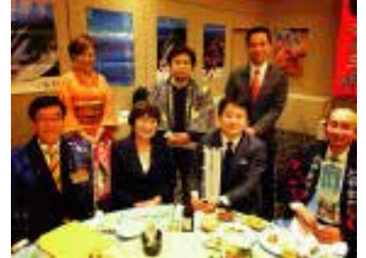
大宮を舞台に東日本連携。南砺市、氷見市長らと